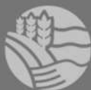
Table de concertation bioalimentaire