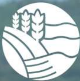
Table de concertation bioalimentaire du Bas-Saint-Laurent