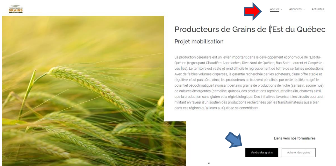
Figure 1. Imprime écran de la page d'accueil de www.pgeq.org

Pour faciliter la tâche, dès que la page est générée à l'écran, les vendeurs ou les acheteurs de grains peuvent aller cliquer sur le bouton Vendre des grains ou Acheter des grains (flèche bleue). Dès lors, une nouvelle page s'ouvre pour se rendre sur le questionnaire monter à partir de Office Forms.