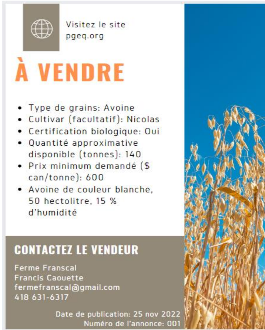
Figure 2. Exemple d'une annonce de grains à vendre

Les annonces sont classées en ordre alphabétique par espèces. Dans la section ANNONCES, le visiteur retrouve une arborescence pour faciliter la recherche (figure3). Les annonces sont datées afin de pouvoir les éliminer facilement. Par exemple, dans le cas où le gestionnaire du site n'aurait pas de retour une fois la transaction conclue.